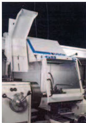
PK-C500 y PK-C600

Resguardos de acero y vidrio laminado triple de 5mm, ambos suspendidos de un carril longitudinal montado en soportes ajustables. Ambos resguardos son deslizantes sobre rodamientos de bolas, y su recorrido es regulable en posición, en profundidad y en inclinación. Incluye iluminación fluorescente (2x15W, 3000lux/400mm) con reactancia de alta frecuencia. Opcionalmente pueden incluir un interruptor de seguridad y un conector para la extracción de humos.